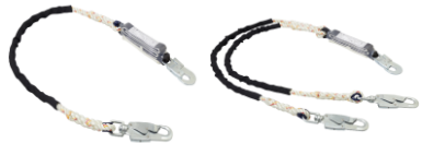
3 M™ DBI-サラ™ EZ-Stop™ ロープランヤード

フックのかけ間違いを防止。 フルハーネス側とアンカー側に 開口サイズが異なるフック。