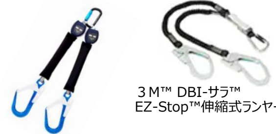
3 M™ DBI-サラ™ EZ-Stop™伸縮式ランヤード